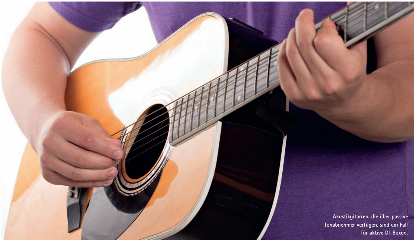
Akustikgitarren, die über passive Tonabnehmer verfügen, sind ein Fall für aktive DI-Boxen.

Geräte ohne Verbindung zum Schutzkontakt des Strom-Netzes, also Keyboards und Line-Quellen mit zweipoligem Euro-Netzstecker,