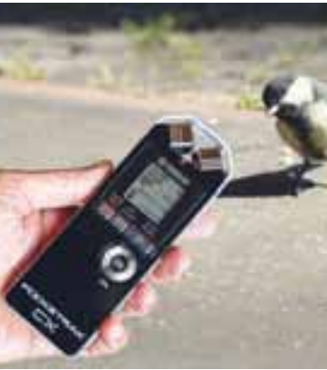
Praktische Hilfsmittel beim Aufnehmen eigener Geräusche oder auch Loops sind Pocket-Recorder wie der Yamaha Pocketrak CX.

Yamaha (Download: http://www.yamaha.co.jp/product/syndtm/dl/utility/twe/ ). Wichtige Editier-Funktionen, die man für die Optimierung seiner Waves braucht, sind Fade-in/out (Ein- und Ausblenden), Normalize (Optimierung der Gesamt-Lautstärke) und die Option, seine Waves auf die eigenen Bedürfnisse zurechtzuschneiden.