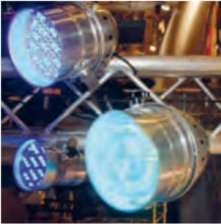
Ideal für Auftritte auf kleinen Bühnen geeignet: LED-Parcan-Scheinwerfer mit 10-mm-LEDs.