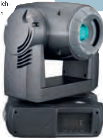
Profiliga: Highend-Moving-Heads wie der Martin Mac 250 Krypton sorgen für tolle Bühnenstimmung.

und das Stimmungslicht montiert werden können. Die gesamte Konstruktion sollte dabei mindestens drei Meter über die Bühnenkante gefahren werden können, damit die Scheinwerfer auch wirklich zur Geltung kommen. Für das Frontlicht wird von vorne wieder mit zwei Stativen gearbeitet, an denen vier Stufenlinsenscheinwerfer zur Ausleuchtung der Akteure befestigt werden.