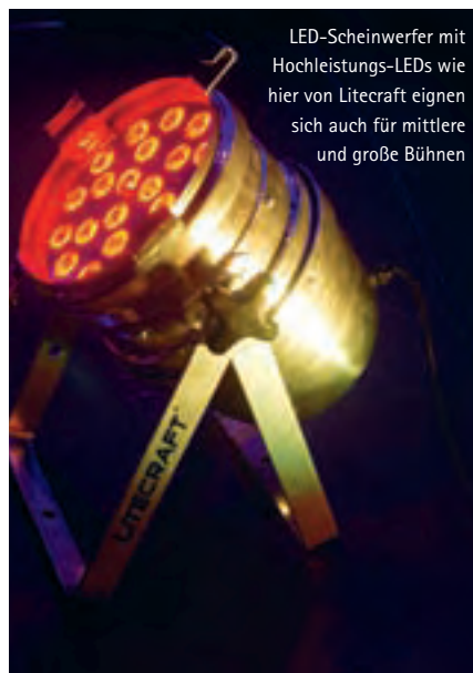
LED-Scheinwerfer mit Hochleistungs-LEDs wie hier von Litecraft eignen sich auch für mittlere und große Bühnen

Ein beträchtlicher Teil der Investitionen bei diesem Vorschlag fließt allein schon in die Bühnenkonstruktion. Hinter der Bühne wird mittels zweier Traversenlifte eine durchgehende Traverse montiert, an der die Effektscheinwerfer