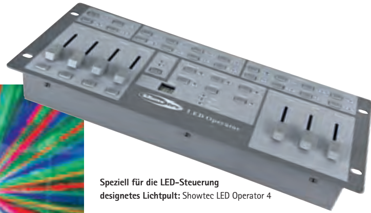
Speziell für die LED-Steuerung designedes Lichtpult: Showtec LED Operator 4

Alternativ wäre auch denkbar, die beiden Effekte im Bühnenhintergrund auf den Boden zu stellen, oder – falls vorhanden – auf zwei Flight-cases. Es sollte nur nicht nonstop jemand davor stehen. Oder ihr gönnt den Effekten noch ein separates Stativ und baut dieses mit den Effekten mittig hinter eure Bühne. Die hier eingesetzten LED-Parcans sind in puncto Helligkeit in etwa mit herkömmlichen 300-Watt-Strahlern zu vergleichen. Da hier jeder Scheinwerfer aber jede Farbe darstellen kann, sind sie deutlich effektiver als beispielsweise eine herkömmliche Anlage mit acht Parcan 56, bei denen jeder Scheinwerfer nur eine Farbe hat.