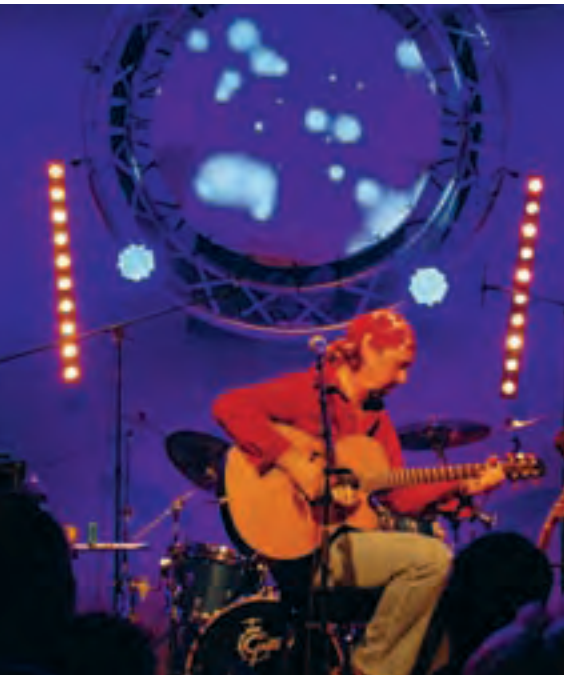
Die reihenförmig angeordneten Leuchten von Sunstrips, hier im Bild vertikal links und rechts, eignen sich perfekt als Blinder, oder auch als Lauf- oder Stimmungslicht.

Auf die vorderen Stative kommen jeweils zwei LED-Parcans. Hierbei werden breit abstrahlende Hochleistungs-LED-Scheinwerfer verwendet, die sowohl im Buntlichtbereich als auch in der Weißlichtmischung ein gutes Ergebnis erzielen. Alternativ könnten hier auch zusätzliche Halogenscheinwerfer zur Ausleuchtung der Musiker eingesetzt werden. Dies würde aber wiederum den Einsatz von Dimmern erfordern.