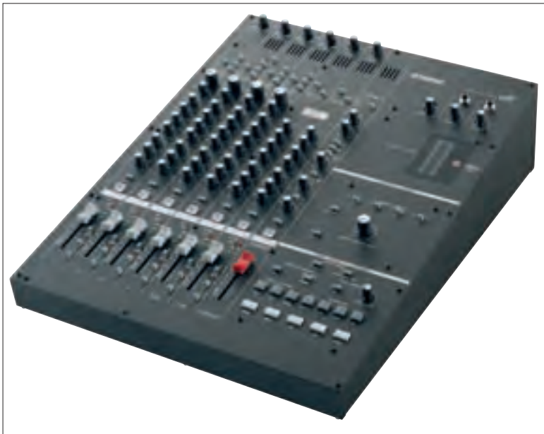
Yamahas Digitalmixer n8 bietet zwei schnelle FireWire-Ports und integriert sich nahtlos in Steinbergs Sequencer Cubase 4.