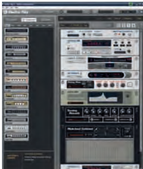
Gelungene Amp-Simulation: GuitarRig von Native Instruments als kompletter Gitarren-Preamp inklusive Effekte.