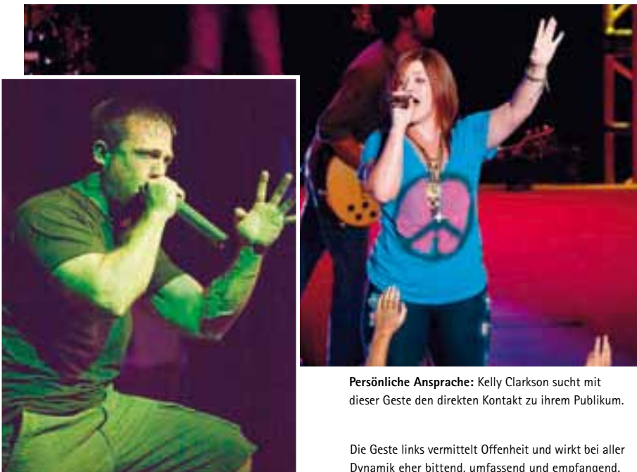
Persönliche Ansprache: Kelly Clarkson sucht mit dieser Geste den direkten Kontakt zu ihrem Publikum.

Das alles könnt ihr übrigens auch gezielt üben. Betrachtet einfach ein Video eurer Performance und analysiert, wie ihr auf diesem Video überkommt, versucht dann eure künftigen Performances gezielt mit Emotionen zu steuern und analysiert euch anschließend wieder visuell. So könnt ihr eure Performance gewissermaßen feintunen. Natürlich könnt ihr aber die ganze Prozedur auch vor einem Spiegel üben, wobei ihr hier natürlich gleichzeitig beobachten und performen müsst.