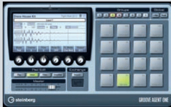
Der Groove Agent One ist ein Sample-Player im Akai MPC-Stil

Um einzelne Bestandteile aus Drum-loops – so genannte Slices – über