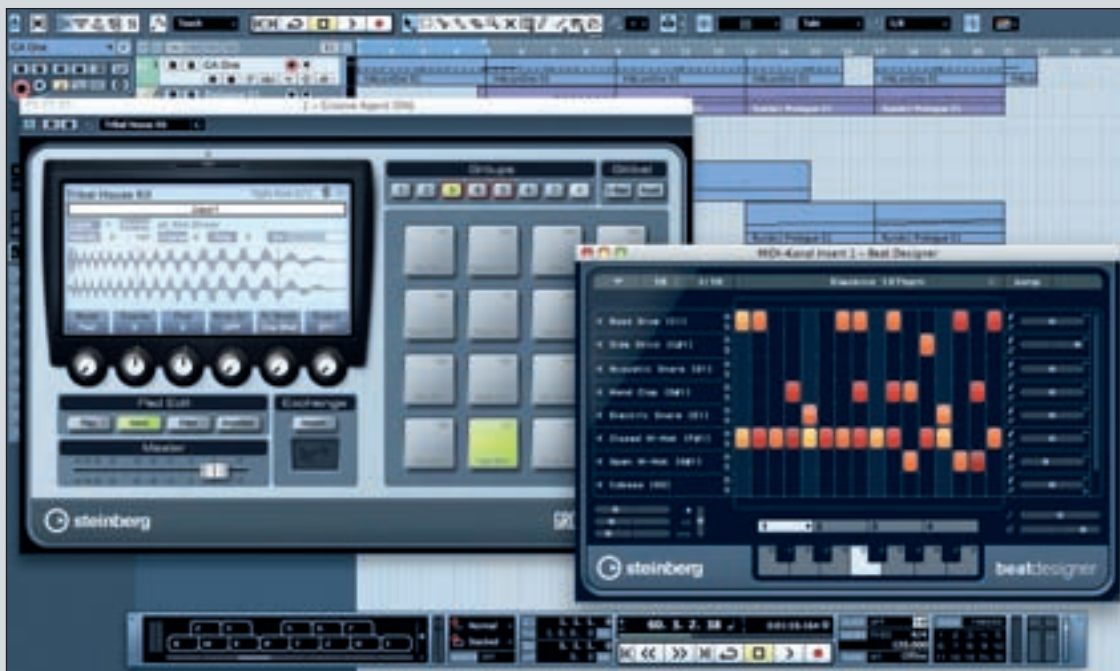
Beat Designer und Groove Agent im Einsatz