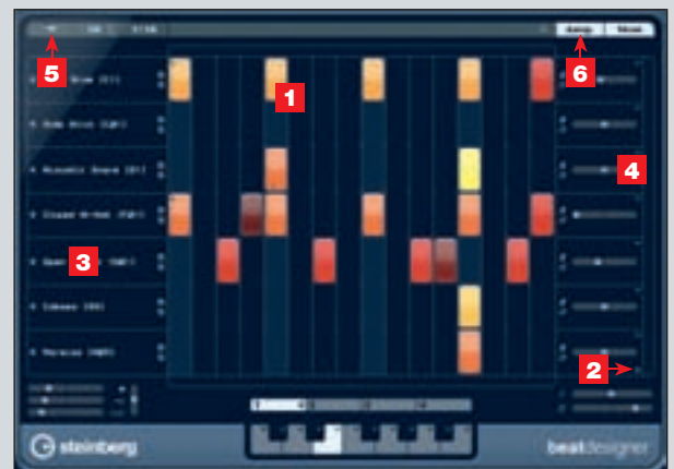
Der neue MIDI-Step-Sequencer mit Lauflichtprogrammierung