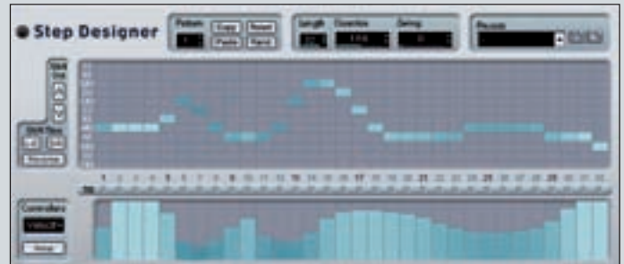
Der Step Designer ist ein echter Step-Sequencer innerhalb von Cubase

• Erzeugen Sie zuerst wie oben beschrieben einen Akkord. Aktivieren Sie dann den Velocity-Switch-Button (den mittleren der drei Buttons unten links). Wählen Sie danach unter Use Zone „2“ an und definieren einen neuen Akkord für dieselbe Trigger Note. Spielen auf Ihrem Master-Keyboard Noten mit verschiedener Anschlagstärke. Bei zwei Zonen ist der Split-Punkt der Akkordumschaltung bei 64, bei weiteren definierten Zonen wer-