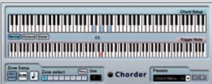
Mit dem Chorder lassen sich blitzschnell Akkorde erzeugen.

stehen drei Modi zur Verfügung. Der Normal -Modus ermöglicht die manuelle Eingabe von Akkorden. Octave ist nahezu identisch mit dem Normal-Modus, außer, dass Sie nur maximal 12 Tasten einer Oktave für die Akkordwiedergabe nutzen können. Die restlichen Tasten anderer Oktaven wiederholen denselben Akkord entsprechend oktaviert. Global erlaubt die Eingabe nur eines Akkordes, jede angeschlagene Taste erzeugt dann eine entsprechend transponierte Variante dieses Akkords.