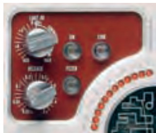
Livetauglich: Kompressoren mit Regelautomatik bieten auf die Schnelle gute Ergebnisse

Dynamikbearbeitung ist besonders während des Mischens unerlässlich. Dann also, wenn man den Kanalzug via Insert als externe Outboard-Gear einbindet. So haben zum Beispiel Vocals in modernen Pop- und