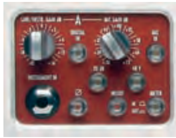
Preamp-Sektion: Neben Gainpotis sind noch ein -20-dB-Pad, sowie Phantompower verfügbar

Kurz: Ob ihr mit dem in eurem Channel Strip verbauten Vorverstärker zufrieden seid, hängt unter anderem wesentlich von eurem eigenen Geschmack und dem bevorzugten Einsatzgebiet ab. Und wenn ihr die Möglichkeit habt: Fragt befreundete Tontechniker oder Musiker, welche Kanalzüge sie einsetzen – und gleicht die verschiedenen Sounds mit eurem Wunschklang ab. Natürlich gibt es zwei-