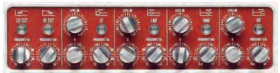
Vollparametrischer 4-Band-EQ inkl. Low- und Hicut: Shelvingfilter für Bässe und Höhen sowie Glockenfilter für die Mitten

Channel Strips sind im Normalfall neben der Eingangsstufe mit separaten EQ-Einheiten ausgestattet. Diese können genutzt werden, wenn der Kanalzug im Mix als externe Gerätschaft eingeschleift wird. Allerdings macht oft schon eine Klangbearbeitung während der Aufnahme Sinn. So erleichtert man sich die Arbeit beim Mischen. Generell sollte man sich hier aber jeden Eingriff sehr genau überlegen und gegebenenfalls nur äußerst sanft zu Werke gehen. Allgemein gilt: Ein EQ sollte vor allem eingesetzt werden, um Frequenzen zu bedämpfen. Bedämpfungen werden vom menschlichen Gehör normalerweise als natürlicher wahrgenommen als Anhebungen.