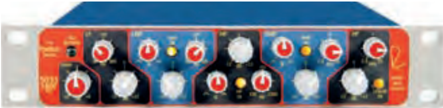
Modularer Channel Strip: Die Portico-Serie bietet einzelne Preamps, EQs und Kompressoren – quasi zum Selbstbau

Rock-Produktionen nur wenig mit der natürlichen Dynamik der Stimme eines Sängers gemein. Will man die Vocals davor bewahren, gnadenlos im Mix unterzugehen, ist der Griff zum Kompressor unerlässlich. Auch deshalb sind Channel Strips heute meist mit Dynamikbearbeitungs-Features ausgestattet. Die Bearbeitung der Dynamik eines Signals bietet sich aber oftmals schon vor der AD-Wandlung an. Das hat verschiedene Gründe: Einerseits gilt es gerade im Fall von AD-Wandlern Übersteuerungen zu verhindern. Überschreitet das Signal hier die 0-dB-Grenze, hat dies sehr unangenehme digitale Verzerrungen zur Folge – analoge Geräte verzeihen leichte Übersteuerungen, im Fall von digitaler Hardware ist die Aufnahme allerdings schnell unbrauchbar. Gerade Klangquellen, bei denen mit großen Dynamiksprüngen zu rechnen ist, sollten daher vorsorglich entsprechendem Processing unterzogen werden. Auch hier gilt allerdings, dass sachte vorgegangen werden sollte. Ansonsten handelt man sich etwa Kompressorpumpen ein.