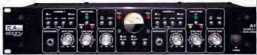
Rackeinbau für die Langlebigkeit: Channel Strips im 19"-Format eignen sich besonders für den Liveeinsatz.

Viele Tontechniker versichern, dass dem Mikro-Preamp soundtechnisch eine ähnlich große Rolle zukommt wie dem Mikro selbst. Und wie es auch im Fall von Mikro-