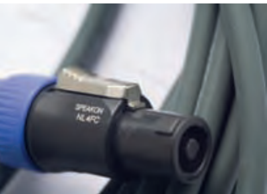
Doppelt in der Buchse gesichert durch die Verriegelung und Drehfixierung: Speakon-Stecker

Innenleiter, den sogenannten „heißen“ Leiter, spricht man von einer unsymmetrischen Leitung, bei der die Abschirmung gleichzeitig auch signalführend ist. Für längere Kabelstrecken eignen sich symmetrische Leitungen besser, hierbei gibt es zwei Adern für das Audiosignal (heiß und kalt) und eine zusätzliche Abschirmung, die mit der Masse der Endgeräte verbunden ist und so noch effektiver vor Störungen schützt.