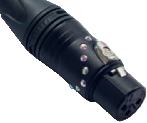
Sichere Steckverbindung durch die Verriegelung: XLR-Stecker Female

schaffung eines Multicores. Es besteht aus einer Stagebox mit zahlreichen XLR- und Klinkenbuchsen, an die alle Bühnensignale von Mikros, Synthesizern etc. angeschlossen werden und von dort aus an einem dicken Kabelbaum vereint zum Mixer laufen. Dort angekommen teilt sich das Multicore wieder in seine einzelnen Adern auf und stellt für jeden Kanal an der Stagebox einen entsprechenden XLR Stecker zur Verfügung, der dann mit dem Pult verbunden werden kann. Die meisten Multicores bieten auch einige Rückkanäle für Signale, die vom Pult auf die Bühne geschickt werden müssen, wie zum Beispiel Monitorwege und natürlich der Gesamtmix auf dem Weg zur PA.