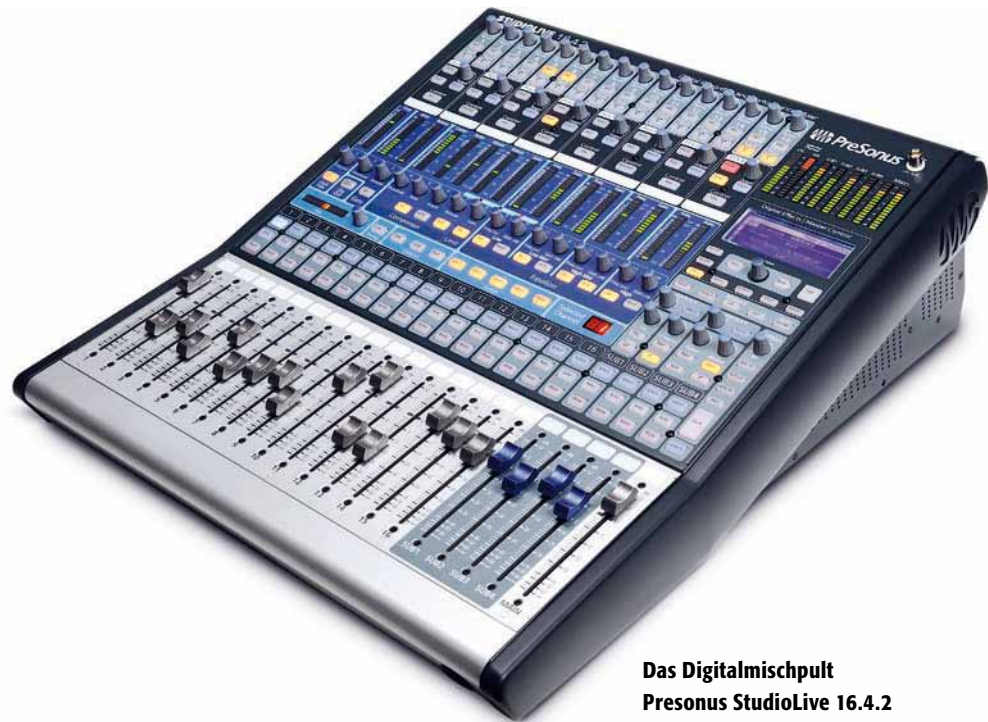
Das Digitalmischpult Presonus StudioLive 16.4.2 mit integriertem Firewire-Interface ist sowohl für den Studio- als auch den Live-Einsatz bestens geeignet.

Der Computer als zentrale Einheit stellt die wichtigste Komponente eures Setups dar. Schließlich steuert ihr damit zu Hause oder auch unterwegs euer gesamtes Audio-Projekt. Notebooks sind hier klar im Vorteil, da sie bereits alles in einem Gerät enthalten: CPU, Speichermedium, Video-Display, Tastatur, Mausersatz und USB- sowie Firewire-Anschlüsse. Netbooks sind zwar zurzeit wegen