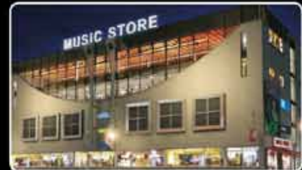
Der Music Store in Köln: ca. 13.000m 2 Lager, Service-, und Demofläche

Mehrere tausend Instrumente versandbereit!